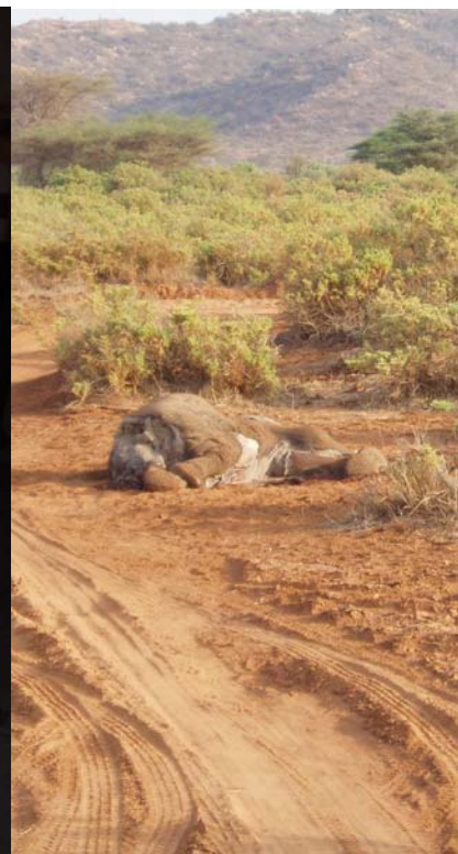
Dode dieren langs de weg (foto olifantenjong)