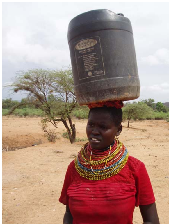
Dagelijks halen de vrouwen water uit de rivier

Het waterproject is in een gevorderd stadium; plaatsbepaling van de te boren put heeft reeds plaatsgevonden. Proefboringen zullen binnenkort van start gaan. De wateropbrengst zal genoeg zijn voor 6 dorpen (ca. 3000 mensen). Vanuit de waterput zullen 3 distributiepunten worden gerealiseerd (2 grote watertanks met aftapkranen). Het te boren gat zal ca. 160 meter diep zijn. Inmiddels weten we dat er een rijke bron aanwezig is. Kosten van het gehele project 100.000 euro.