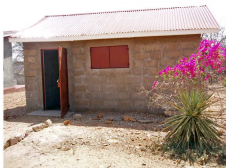
Een door de Samburu zelf gebouwde voorraadschuur. De stenen zijn door hen zelf geproduceerd.