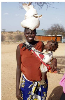
Een Samburu vrouw, met een zak bonen en mais.

Een voedseltransport is gerealiseerd tijdens het verblijf van een deel van het bestuur. Gelukkig werkt het watersysteem perfect. Voor de bevolking is voldoende drinkwater beschikbaar.