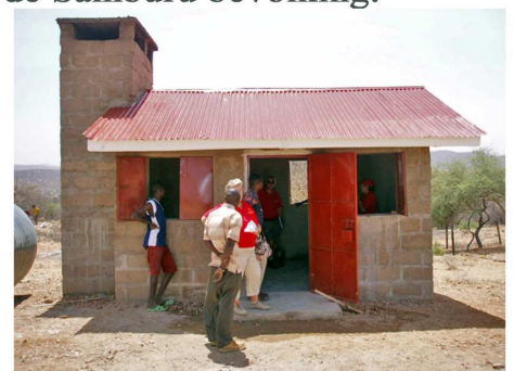
Ook de nieuwe keuken is gerealiseerd door de Samburu zelf. Een grote vooruitgang voor de kok en de schoolgaande kinderen.