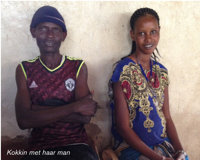
Kokkin met haar man

Keurig de anatomie van de vrouwelijke en mannelijke geslachtsorganen. Het hormonale mechanisme er schematisch naast getekend. Onder op het bord voorbeelden van anticonceptie.