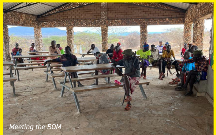
Meeting the BOM

PM: er zijn weer enkele van de leuke bronzen beeldjes uitgedeeld aan donateurs die een voldoende (veelal fiscaal aftrekbare) bijdrage storten. Een mooie vorm van sponsoring waarbij beide partijen happy zijn. Zie onze website watotosamburu.nl/sponsoring .