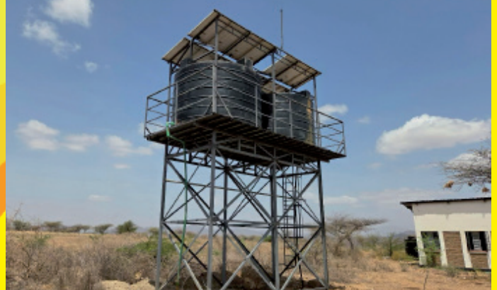
Nieuwe watertanks naast de school, gevuld vanuit de nieuwe bron

camerabewaking is, lijken al voldoende om vandalen weg te houden. Zo zien we handige moderne technologie doordringen in deze afgelegen en ruige omgeving.