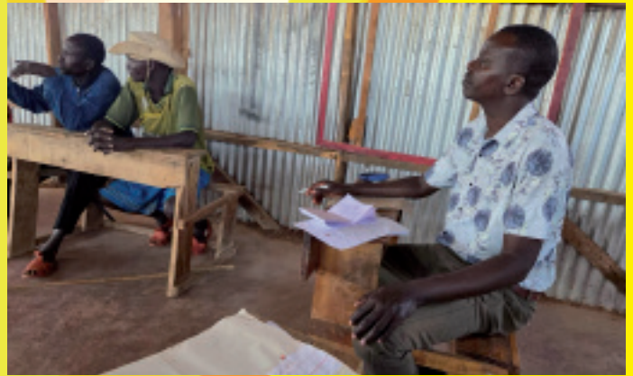
BOM meeting met links 2 lokale bestuurders en rechts de head teacher van de school