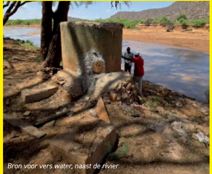
Bron voor vers water, naast de rivier

die al geregeld in de BOM meetings is besproken. Er zijn al diverse ontwerpen gemaakt, die steeds verder worden bijgeschaafd. De regels en voorschriften zijn in kaart gebracht. Ook begrotingen voor de bouwkosten en bouwers zijn op tafel gekomen. Om de totale consequenties te overzien, moet er ook begroot worden wat de extra jaarlijkse doorlopende operationele kosten zullen zijn. Zoals voor extra voedsel en personeel. En anderzijds wat de extra bijdrage vanuit de overheid is aan een boarding school. Daartoe moet ook de status van de school veranderd worden van day school in boarding school.