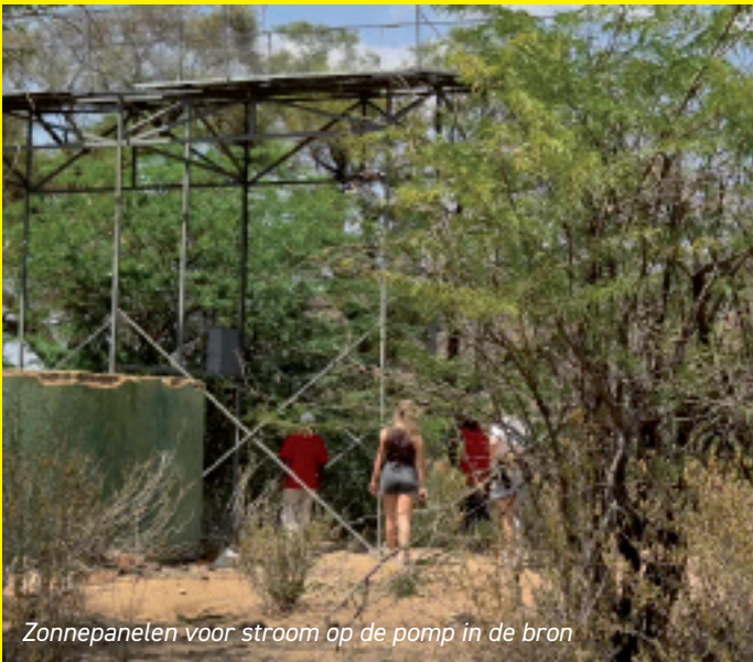
Zonnepanelen voor stroom op de pomp in de bron